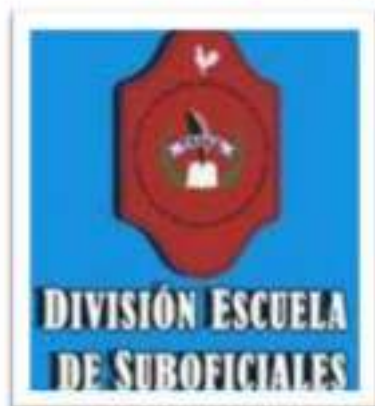
"General Francisco Ramírez" Villaguay - Entre Ríos