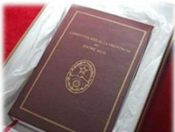
Ejemplar de la Constitución tras la Reforma de 2008

En enero de 2008 comenzó a sesionar una convención constituyente que reformó la Constitución Provincial, presidida por Jorge Busti, quien poco antes ejerció la gobernación de la provincia.